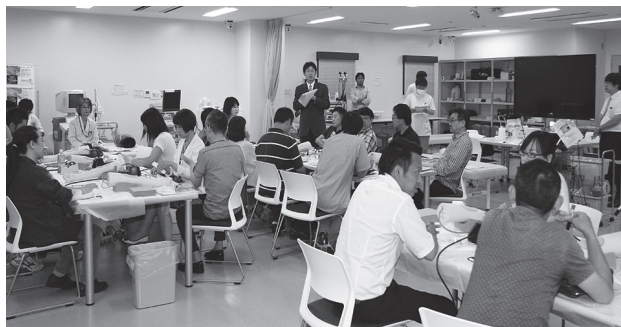
シミュレーター実習室(スキルスラボ)での採血・ルート確保実習

当施設では、2012年10月に外部の先生方と一緒に香川大学医学部附属病院歯・顎・口腔外科インプラント講習会を発足いたしました。現在は、当医局員と合わせて約40名の会員が所属しています。一昨年より新型コロナウイルス感染拡大もあり十分な講習会開催が厳しい状況でしたが、基本的には月に1～2回開催しており、講師として歯科医師だけでなく、歯科技工士や歯科衛生士、さらには医科関連